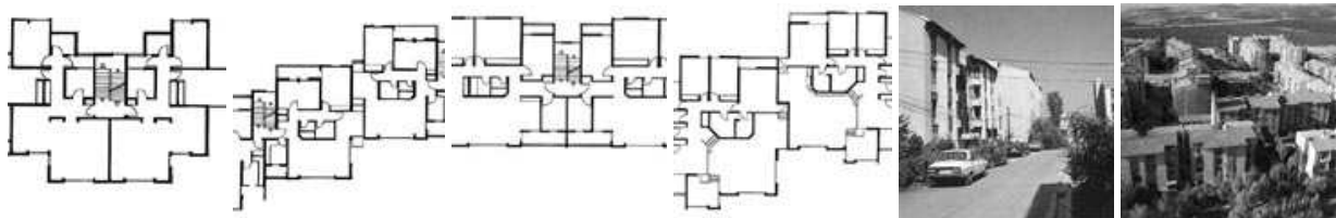
Şekil 4.Or-an Şehri Konutları (Şevki Vanlı, 1970), (22)

1980'li yıllarda hızlı kentleşme sonucu büyüyen kentler, gecekondular alanlarını da içine almış, bu alanlardaki kentsel toprak rantı yükselmiş, 1984'de çıkarılan 2981 sayılı İmar Affı yasası ile bu değerlendirilmiş topraklar üzerindeki gecekonduların, mevcut imar düzenine göre katlı konutlara dönüşmesine olanak tanınmıştır. Bu süreçte gecekondulara tanınan haklar ve değişen imar planları ile artan nüfusun gereksinimini karşılayacak, enflasyona karşı değerini koruyarak statü sağlayacak konut üretimi yap-sat olarak tanımlanan bir üretim biçimini doğurmuştur (24). Bu bağlamda arazinin büyüklüğüne göre yap-şatçı müteahhitler veya büyük inşaat şirketleri aracılığıyla konut üretimi sürmüş, diğer kentlerde olduğu gibi Ankara'da da betonarme yapım tekniği ile apartmanlaşma bir seçenek olarak görülmüştür (25). Kent içinde arazi bedellerinin artması da apartmanlaşma ve kat arttırımını körüklemiştir. 1980 sonrası konut üretim sürecinde ağırlıklı rol oynayan büyük inşaat şirketleri kent dışında satın aldıkları ve imar planı hazırlanan arazilerde konut yapımına başlamışlardır. Bu dönemde askeri yönetimin toplu konut projelerini ulusal bütçeden finanse etmek istemesi, konut edinmek isteyenlere ve yapı kooperatifleri üyelerine kredi sağlanması (26) devlet kuruluşları (Türkiye Emlak Bankası, Toplu Konut