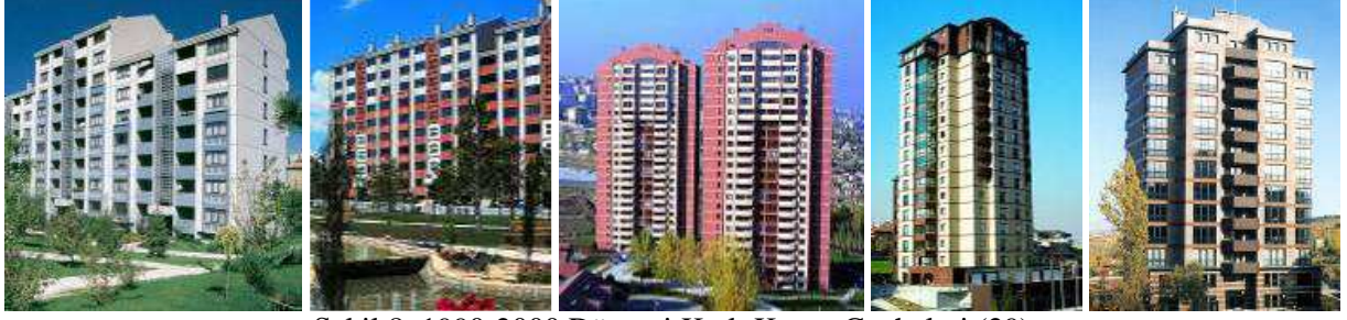
Şekil 8. 1990-2000 Dönemi Katlı Konut Cepheleri (29)

2000’li yıllarda üretilen konutlar çok katlı, hareketli ve renklidir. Konut cephelerinde giderek çeşitlenen yapı malzemelerinin de katkısıyla farklı dil oluşturmaya çalışılmıştır. Motif çıkma, renk kullanımı, tonoz çatı ile biçimsel farklılık yaratmaya çalışan ve son katlarda final etkisi yaratan cephe örneklerine de rastlanmaktadır (Bkz. Geçak II ve III Koza, Akasya konutları). Genellikle üst gelir grubuna yönelik olarak üretilen bu konutlarda 1990’lı yıllarda benimsenen cephe anlayışının da kısmen sürdüğü gözlemlenmektedir (Bkz. Yonca Evler I. ve II. Etap konutları), (Şekil 9).