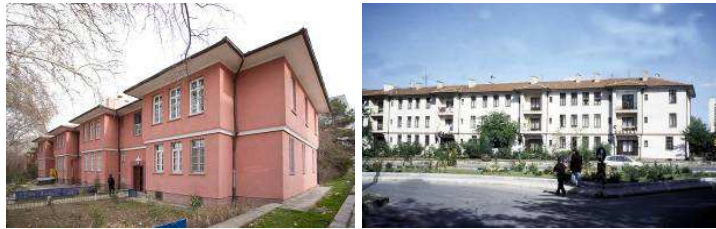
Şekil 3. Saraçoğlu Mahallesi (14, 15)

1946-47 yılları hükümet programları konut sektörüne iyi örnek olabilecek işçi ve memur konutlarının üretilmesine ilişkin açıklamalar bulunmaktadır. Ankara çevresinde ilk kez 1930'lu yıllarda ortaya çıkan gecekondu, 1950'li yıllarda tarımda makineleşme ve savaş yıllarında güçlenen özel sektör için gereksinim duyulan işçilerin kente göç etmesi ile artmıştır (3). Buna koşut olarak konut talebi ve üretimi artmış (9), Jansen Planı'nın artan kat talepleri ile delinmesi sonucu (5) hükümet politikaları gecekondulaşma ile mücadele, orta sınıfın konut sorunu çözmek üzere çok katlı yapılara izin veren yasal düzenlemelerle ortaya çıkan apartmanlaşma ve yeni planlı kentsel alanların yaratılması konularında