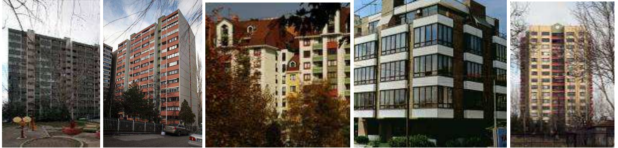
Şekil 7. 1980-1990 Dönemi Katlı Konut Cepheleri (29)

1980 sonrası serbest piyasa ekonomisinin benimsenmesi, ithalatın artması ile çeşitlenen yapı malzemeleri konut cephelerinin farklılaşmasına neden olmuştur. Toplu konut uygulamalarının artması özel sektörün konut üretimine ilgisini arttırmış ve büyük inşaat firmalarının da katılımıyla rekabet ortamı doğmuştur. 1980'lerin başında orta, üst-orta ve üst gelir grubu kullanıcılar için üretilmiş ilk örneklerin (Bkz. Taşocağı Yankı ve Taşocağı Yamaç 1 konutları) genellikle her katta iki dairenin bir araya gelmesi ile üretilmiş bloklar halinde biçimlendiği görülmektedir. Çok katlı, gizli çatılı bu örneklerin cepheleri yalın, az renkli ve hareketsizdir. Kent içinde uygulanan katlı konutlarda, konutun bulunduğu sokak gabarisine uygun olarak az katlı ve hareketli cephe örneklerine de rastlanmaktadır (Bkz. Ayrancı konutları). 1980'li yılların ortalarında her katta dört daireden oluşan, masif ve çok katlı tek blok halinde üretilen örneklerin cepheleri de yalın, hareketsiz ve az renkli olarak değerlendirilebilir (Bkz. Oran konutları). 1980'lerin sonlarına doğru oldukça hareketli ve renkli olan konut cephelerinde (Bkz. Koru Sitesi) çatıların da cephe bileşeni olarak kompozisyona katıldığı, son katta yer alan dubleks dairelerde çatı pencerelerinin kullanıldığı görülmektedir (Şekil 7).