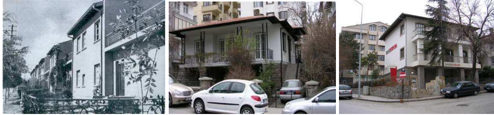
Şekil 2. Bahçelievler ve Gaziosmanpaşa Konutları (12, 13)