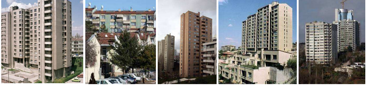
Şekil 6. 1970-1980 Dönemi Katlı Konut Cepheleri (29)

sıradandır. Konutların gelir grubuna bakılmaksızın ısı kaybını azaltmaya yönelik olarak, dış yüzeyler birleştirilerek sıra ev şeklinde üretildiği görülmektedir (Bkz. Çankaya Merkez ve Çankaya İşçi Yapı Kooperatifi, Batı ve Güneş Sitesi), (Şekil 6). Üst, üst-orta gelir grubu kullanıcılar için üretilen konutlar ise genellikle çok katlıdır. Ancak az ve çok katlı konutların bir arada olduğu örneklere de rastlanmaktadır (Bkz. Güneş Sitesi). 1970'li yılların sonlarına doğru üretilen çok katlı konutların cepheleri ise yalın, hareketsiz ve renksizdir (Bkz. Gaziosmanpaşa Sitesi).