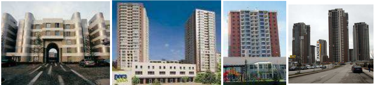
Şekil 10. 2000-2010 Dönemi Katlı Konut Cepheleri (29)

2000-2010 yılları arasında az ve çok katlı konut yapıları bir arada görülmektedir. Üst gelir grubu kullanıcılar için tasarlanmış konutlarda masif, tek veya birkaç blok halinde veya blokların bir araya gelmesi ile sıra oluşturan konutlara da rastlanmaktadır. Çok katlı, masif bloklar halinde üretilmiş konutlar sosyal amaçlı kullanılacak az katlı kütlelerle birlikte planlanmıştır (Bkz. Dora Evleri, Erler Mahallesi). Bundan başka çeşitli renk ve nitelikte malzemelerin kullanıldığı, çıkma ve merdivenkovası biçimlenmesi ile farklılık yaratmaya çalışan konutlar da üretilmiştir (Bkz. Yankı Evler I. Etap). 2000’li yılların son dönemlerine doğru kentte arazi bedellerinin artması üst gelir grubu kullanıcılar için üretilen konutlarda kat adetlerinin fark edilir biçimde artmasına neden olmuştur. Bu dönem konutlarında önceki yıllarda üretilen konutlara kıyasla sosyo-ekonomik yapının ve kullanıcı profilinin konut cephelerinde dış vurulduğu örnekler görülmektedir (Bkz. Park Oran konutları) (Şekil 10). Tablo 1’de 1970-2010 yılları arasında ME-SA şirketi tarafından Ankara’da gerçekleştirilen ve bu çalışma kapsamında dil, biçim, malzeme, çatı ve pencere gibi cepheyi oluşturan bileşenler açısından incelenen konutlar ifade edilmektedir. Tablo 2’de ise incelenen örnekler konut düzeni, kat adedi, cephe düzeni/niteliği ve çatı açısından analizi görülmektedir.