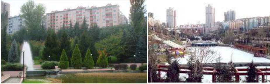
Şekil 5. Dikmen ve Portakal Çiçeği Vadisi Konutları (13, 28)

1990'ler rant sağlamak amacıyla artan gecekonduların kentsel dönüşüm kapsamına alındığı ve yoğun konut üretiminin gerçekleştiği yıllardır. Portakal Çiçeği ve Dikmen Vadisi (Şekil 5) gibi kentsel dönüşüm projeleri gecekonduların sahiplerine konut edinme fırsatı verirken, rantı arttıracak uygulamaların önünü açmıştır. 2000'li yıllardan itibaren hükümet programlarında ve belediyelerin eylem planlarında konut, kentleşme ve kentsel dönüşüm konularına yer verildiği ve kentsel yaşam kalitesinin artırılması açısından kentsel dönüşümün gerekliliğinin vurgulandığı görülmektedir. Hükümetlerin konut politikalarında yer alan konut üretimi, düzenli kentleşme ve yaşam kalitesinin artırılması gibi hedefler toplu konut ve kentsel dönüşüm projelerinin artmasına neden olmuştur. TOKİ'nin 2004 yılında tekrar Başbakanlık'a bağlanması arazi ve konut üretimi, gecekonduların dönüşümü ve kentsel yenileme konularında TOKİ'nin gücünü artırmış, öte yandan yaptırımlarla gecekondular ve kaçak yapılaşmanın önüne geçilmesine çalışılmıştır (29). Ankara'da 2000'li yıllarda yerel yönetim ve özel sektör işbirliğinde gelişen ve gecekonduların tasfiyesine veya iyileştirilerek yeniden kazanımına yönelik gerçekleştirilen Doğu Kent, Kuzey Ankara gibi kentsel dönüşüm projeleri yoğunluk artarak sürdürülmüştür.